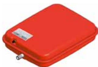
Disegno / Drawing P637/L