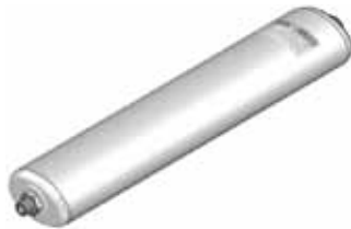
Disegno / Drawing 564