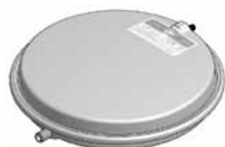
Disegno / Drawing 533