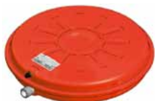
Disegno / Drawing 531/L