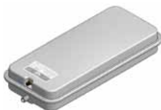
Disegno / Drawing 518