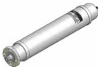
Disegno / Drawing 564/F