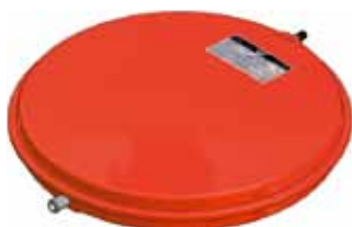
Disegno / Drawing 522/L