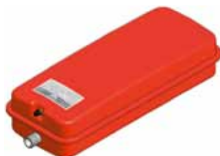
Disegno / Drawing 537/L