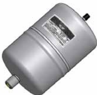
Disegno / Drawing 20016