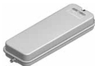
Disegno / Drawing 537/XL