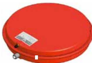
Disegno / Drawing 521/L