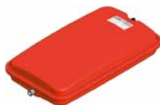
Disegno / Drawing 539/L