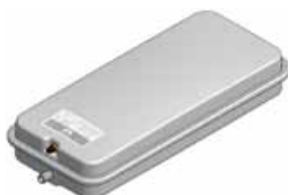
Disegno / Drawing 539/XL