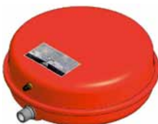
Disegno / Drawing 541/L